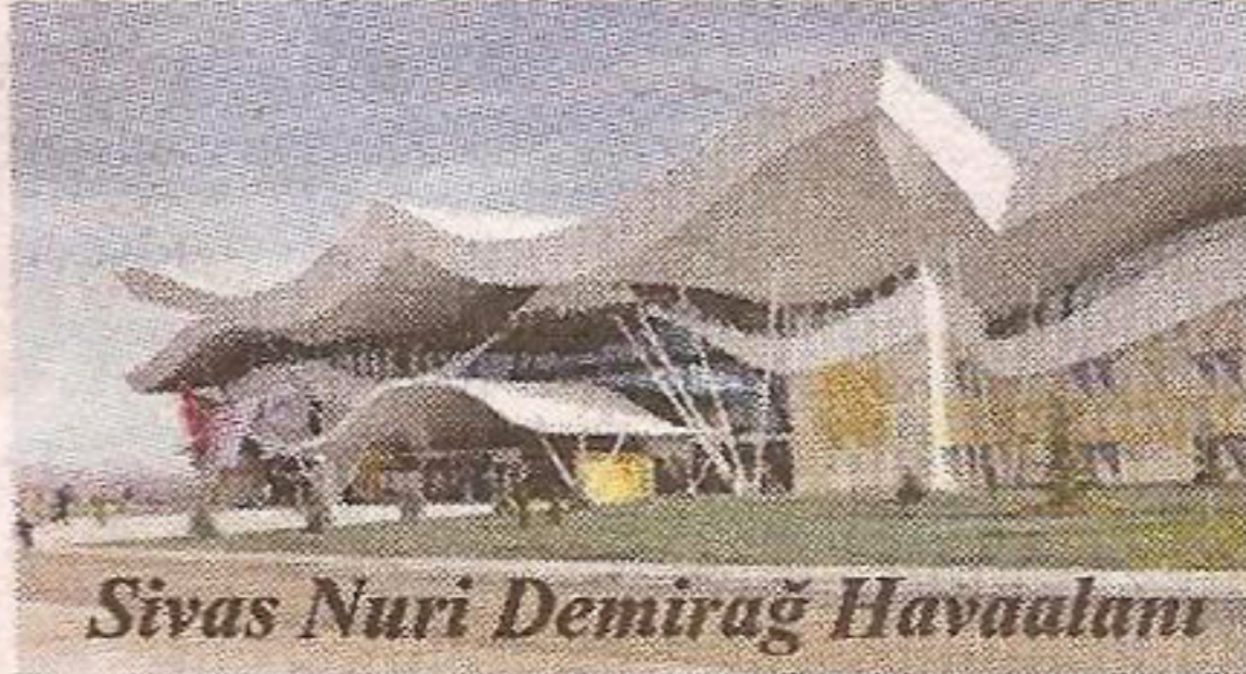
Sivas Nuri Demirağ Havaalanı